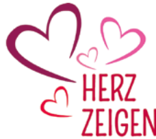
Eine Aktion des KDFB Augsburg

Lesen Sie die „Herzgeschichte“ und verschenken Sie anschließend bunte Herzen an Flüchtlinge und ehrenamtliche Helferinnen und Helfer. Dies kann in eine traditionell stattfindende Zweigvereinsaktion eingebettet werden (Adventsbasar, -feier, Weiberfasching, Fastenandacht, Fastenessen,...) oder bei einer Aktion hinsichtlich eines Gedenktages stattfinden, z.B. Tag des Ehrenamts, Welttag der Menschenrechte, Tag der unschuldigen Kinder, Weltfrauentag, u.a. (siehe auch www.frauenbund-augsburg.de/themenprojekte/aktion-herz-zeigen .)